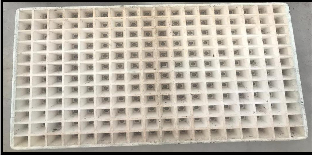
Representative Picture 2 / Temsili Resim 2