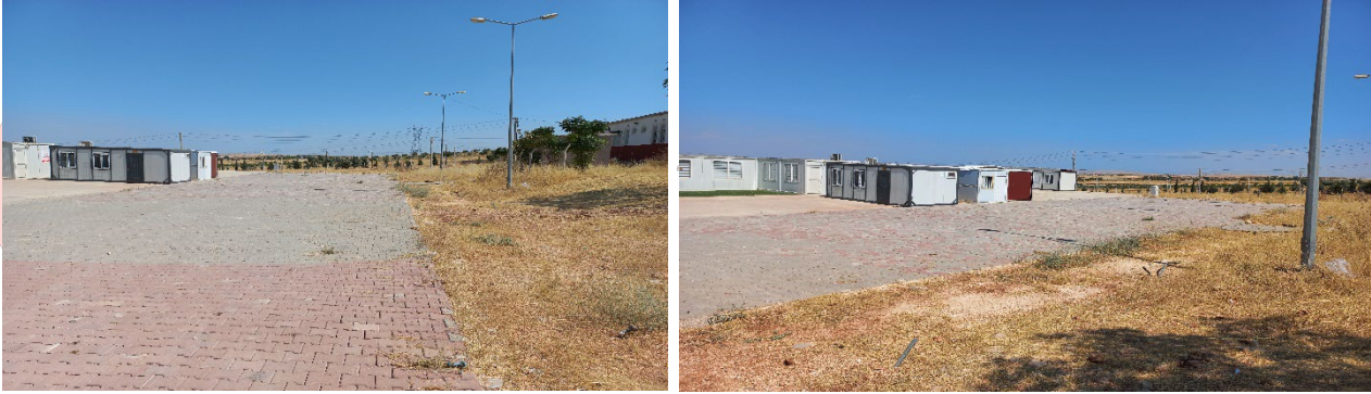
Resim: Uygulama Sahası (Parke taşı söküm ve toprak kazısı)