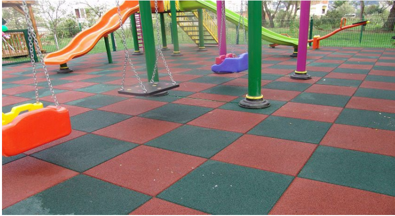
Örnek Resim: Kauçuk Zemin Kaplama

Yükleniciye “Kauçuk Zemin kaplama” işi yapılacak yerler/mahaller işe başlamadan önce proje uygulama sahasında gösterilecektir.