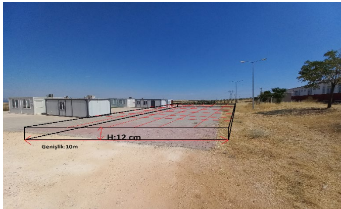
Resim: Uygulama sahası beton dökümü gerçekleştirilecek alan(parke taşı sökümünden sonra)

Yükleniciye "Saha beton" işi yapılacak yerler/Mahler işe başlamadan önce proje uygulama sahasında gösterilecektir